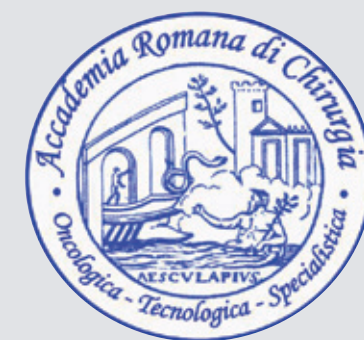
A.R.C. Accademia Romana di Chirurgia