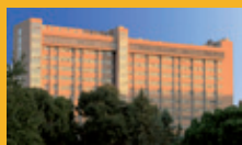
Ospedale S. Eugenio Dipartimento di Chirurgia